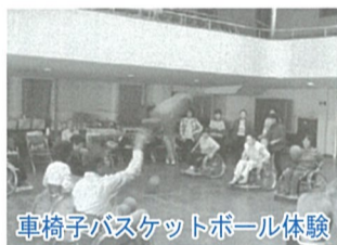
車椅子バスケットボール体験