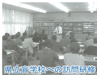
県立盲学校への訪問研修

☆ 障害者施設の自主製品紹介冊子「かけはし」を多くの人々に利用していただき、施設の皆さんが働く喜びを感じられるようご協力を重ねてお願いします。