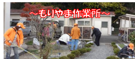
11月30日(木) ボランティア部会