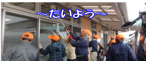
11月22日(水) 広報啓発部会

昨年度に引き続き、学区内の福祉施設の奉仕活動を学区社協全員が各部会に分かれて実施しました。窓ガラスや床拭き、外回りの清掃など短い時間ではありましたが、普段なかなか手が届かない箇所を隅々まで掃除しました。参加していただいた皆さんありがとうございました。