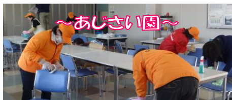
11月28日(火) 福祉人権部会