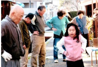
【ラジオ体操の様子】